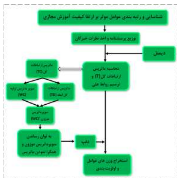
شکل ۱- مراحل پژوهش